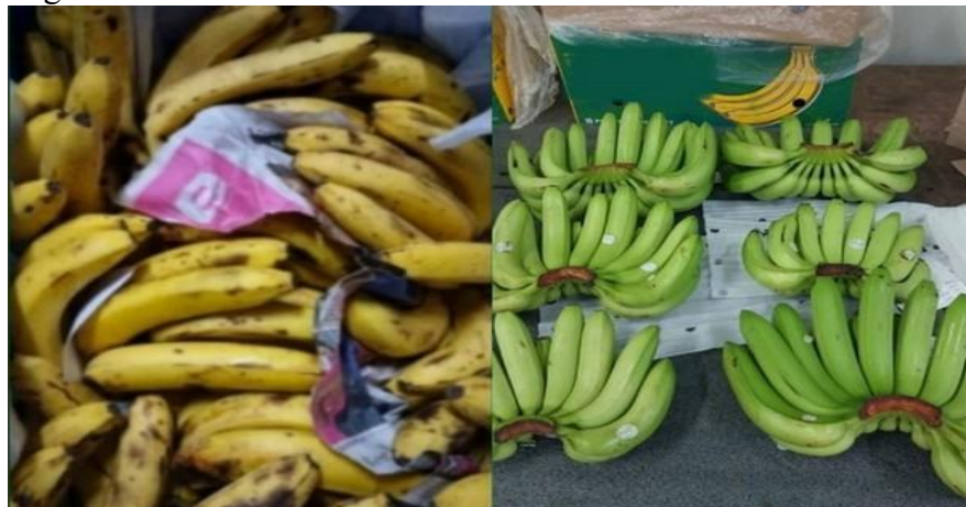
Chuối sau 40 ngày.

cũng loại bỏ nhu cầu xử lý bổ sung, chẳng hạn như thay đổi bao bì trước khi chín, giúp tiết kiệm cả thời gian và công sức. Những khác biệt nhỏ này có thể tạo ra tác động lớn trong chuỗi cung ứng."