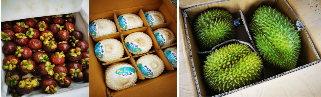
Trái: măng cụt Thái; Phải: Dừa non Thái Lan/ Sầu riêng nhập khẩu

Giá việt quất đã phục hồi trong tuần này sau hai tuần giảm do lượng khách đến giảm. Giá quả việt quất 15mm+ hiện ở mức khoảng ¥90-¥95/quả, tăng 10-¥15 so với tuần trước.