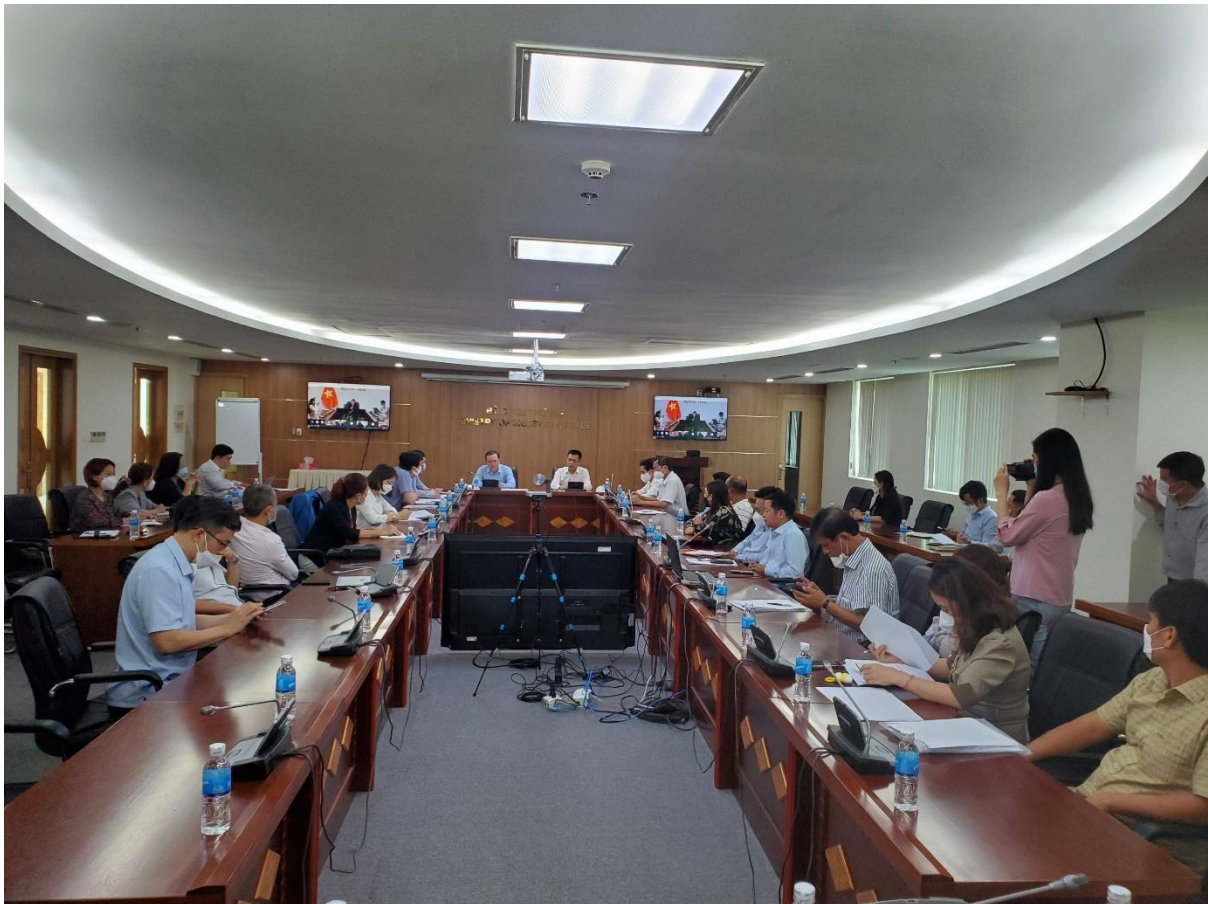
Bộ Công thương tổ chức họp khẩn với VINACAS và các Doanh nghiệp

Cục cảnh sát điều tra tội phạm về tham nhũng, kinh tế, buôn lậu, Bộ Công an làm việc trực tiếp với lãnh đạo VINACAS.