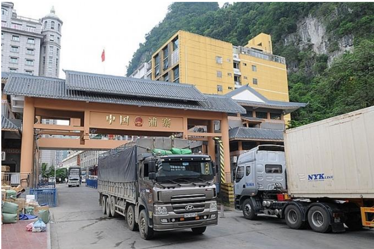
Hàng hóa xuất bằng đường bộ qua các cửa khẩu phía Bắc