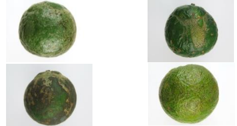
Khuyết tật gây ra bởi côn trùng và nhện

6. ĐƠN VỊ CHUYÊN GIAO: VIỆN CÂY ĂN QUẢ MIỀN NAM