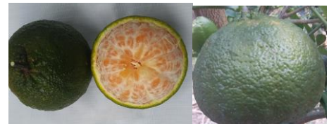
Hình dạng bên ngoài