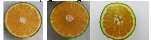
Hình dạng bên ngoài